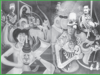
山下菊二<供御画>(1969年) 〔「思想運動」2016年9月1日号〕