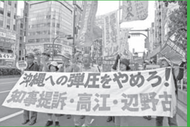
辺野古基地建設も高江ヘリパッドも許すな! 9・11新宿デモ 〔「思想運動」2016年9月15日号〕