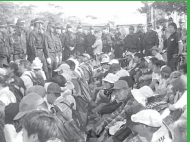
高江ヘリパッド建設を阻止するぞ! 1分1秒でも土砂搬入を遅らせよう! 〔「思想運動」2016年10月15日号〕