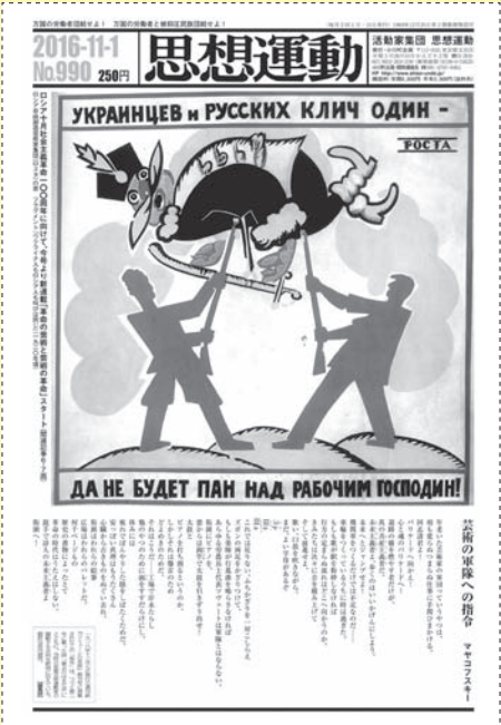
〔990(2016年11月1日)号1面〕「ロシア十月社会主義革命100周年へ向けて」の連載がスタート!

● 主張 資本主義の混迷は深まる一方。にもかかわらず、資本主義を打ち倒し社会主義をめざす運動は思想的頹廢の極限に達している。社会主義と労働者階級の国際主義に立脚した〈主張〉を展開し、労働者人民の進むべき道を指し示す。