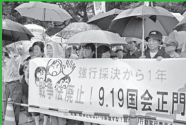
戦争法の強行成立から1年目にあたる9月19日、国会正門前行動には2万3000人が結集した。 〔「思想運動」2016年10月1日号〕